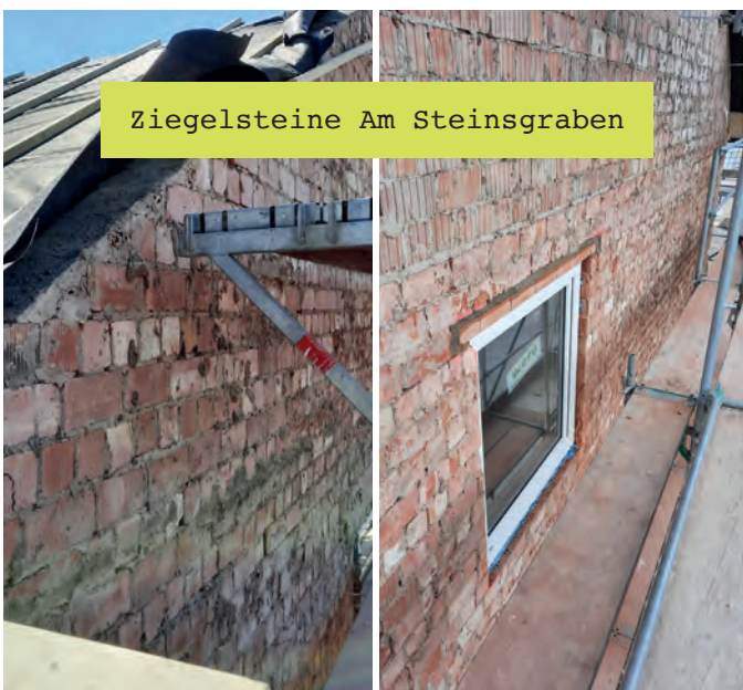
Ziegelsteine Am Steinsgraben