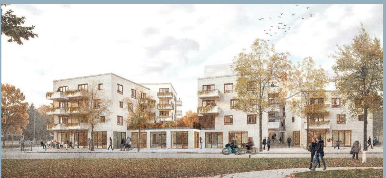
PREISTRÄGER ENTWURF 502 – SPENGLER WIESCHOLEK ARCHITEKTUR

Dieser Entwurf verbindet die bestehende gründerzeitliche Bebauung harmonisch mit der angrenzenden Bebauung und schafft ein Ensemble, das Tradition und Moderne geschickt vereint.