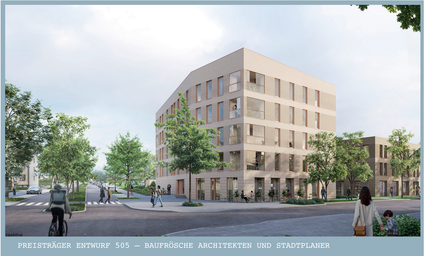
PREISTRÄGER ENTWURF 505 — BAUFRÖSCHE ARCHITEKTEN UND STADTPLANER

Dieser Entwurf besticht durch seine klare, moderne Architektursprache und eine durchdachte städtebauliche Einbindung. Besonders das markante Eckgebäude setzt einen prägnanten Akzent als Eingang zur „Grünen Mitte Ebertal“. Hochwertige Freiflächen, neue Wegebeziehungen und weitläufige unversiegelte Bereiche werten das Umfeld auf.