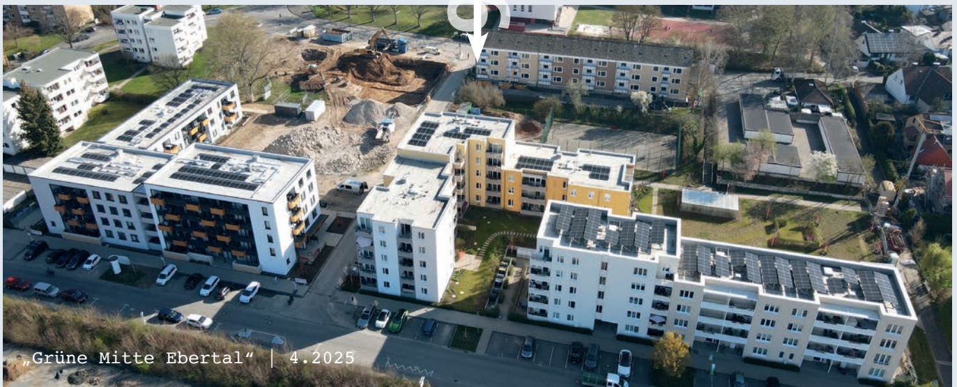
„Grüne Mitte Ebertal“ | 4.2025